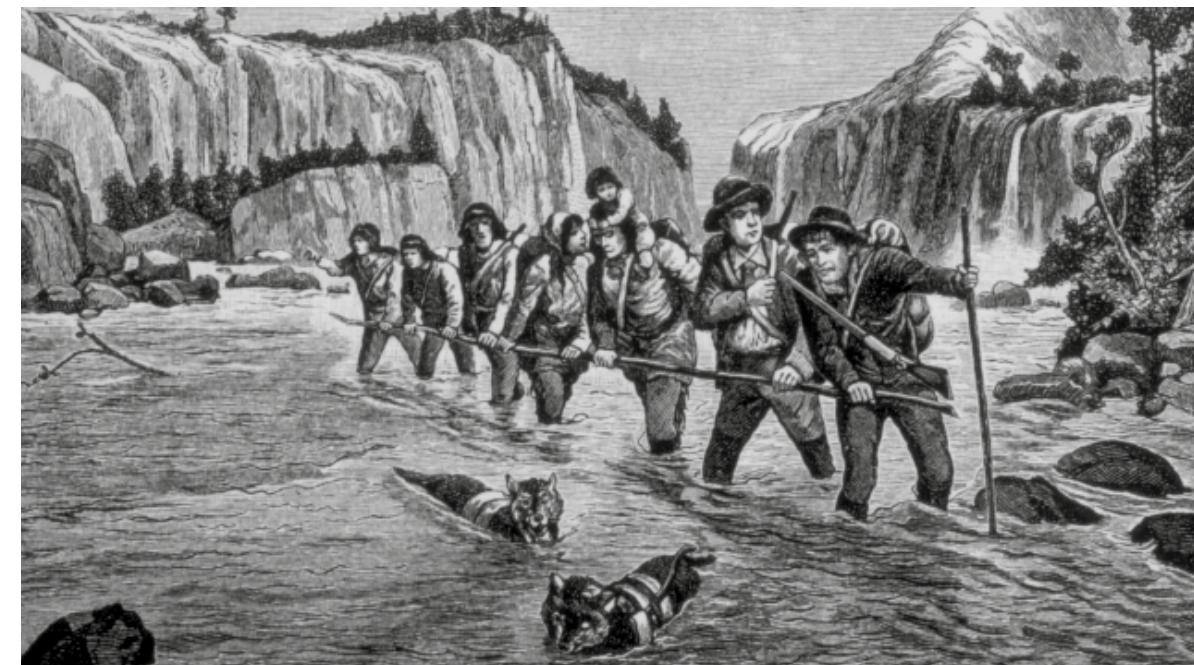
Goudzoekers onderweg naar de Klondike, gravure uit 1898

Afgezien van de lokale onlusten in Frankrijk, Nederland en België was Frans-Duitse oorlog van 1870 het enige internationale conflict van formaat tijdens de Gouden 19de Eeuw. Deze kortstondige oorlog had bovendien geen enkel effect op de rest van Europa. Deze ongekende rust was goed voor de handel.