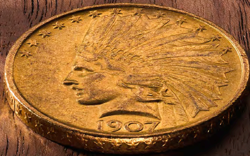
10 Dollar Indian Head (zonder motto)