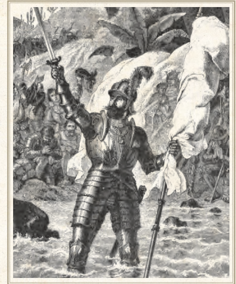
▲ De Spaanse ontdekkingsreiziger en veroveraar Vasco Núñez de Balboa eist in 1513 de kust van Panama - de Stille Oceaan - op voor Spanje. Panama eert ook vandaag nog deze Spaanse ontdekkingsreiziger in de naam van zijn munteenheid die Balbao heet.

De Amerikaanse gebieden werden verdeeld tussen Spanje en Groot-Brittannië, vanaf dan de twee grootste koloniale mogendheden in de Amerika's.