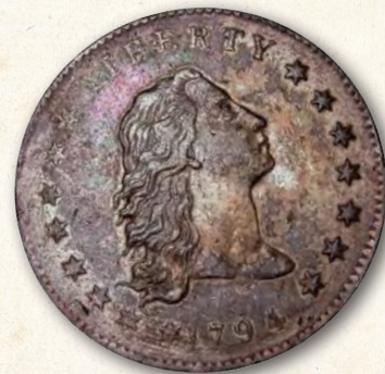
▲ De 'Flowing Hair' Dollar

Dubbele Eagle bezet sindsdien de tweede plaats. Onder de duurste munten ter wereld bevinden zich ook nog een zilveren Dollar met jaartal aanduiding 1804, geveild voor $4.140.000 in 1999. Een zilveren Amerikaanse 'Nickel', een munt van 5 Dollarcent, uit 1913 is verkocht voor $3.737.500. Van de gouden Dubbele Eagle 1907 met hoog reliëf zijn maar 24 stuks geslagen omdat het productieproces te moeilijk was. Een exemplaar is verkocht voor $2.990.000. De prijzen van werkelijk zeldzame munten stijgen nog steeds. De limiet lijkt nog niet bereikt.