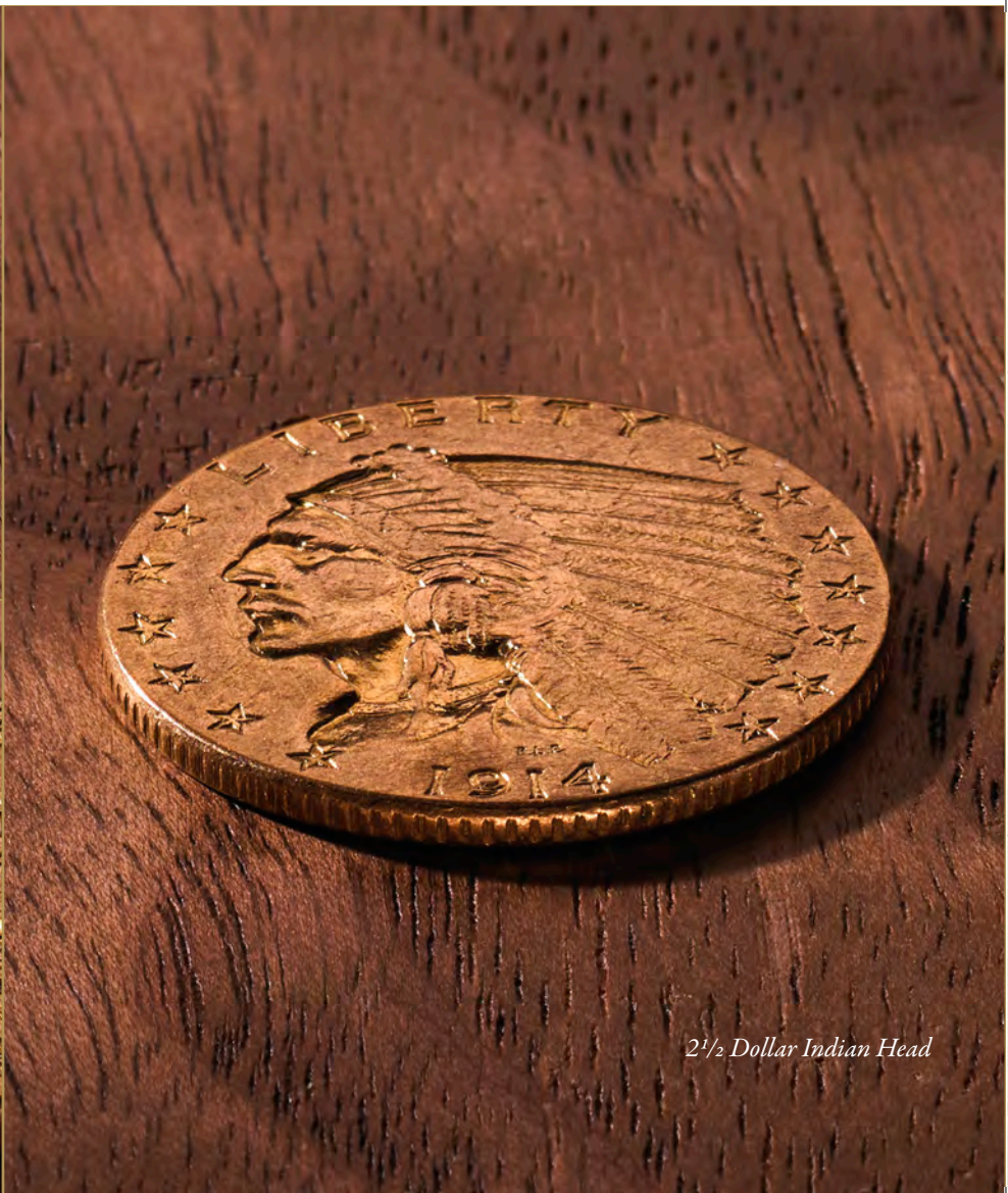
2 1/2 Dollar Indian Head