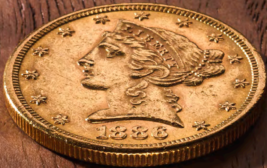
5 Dollar Liberty Head (met motto)