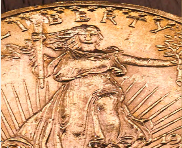
20 Dollar Double Eagle St. Gaudens