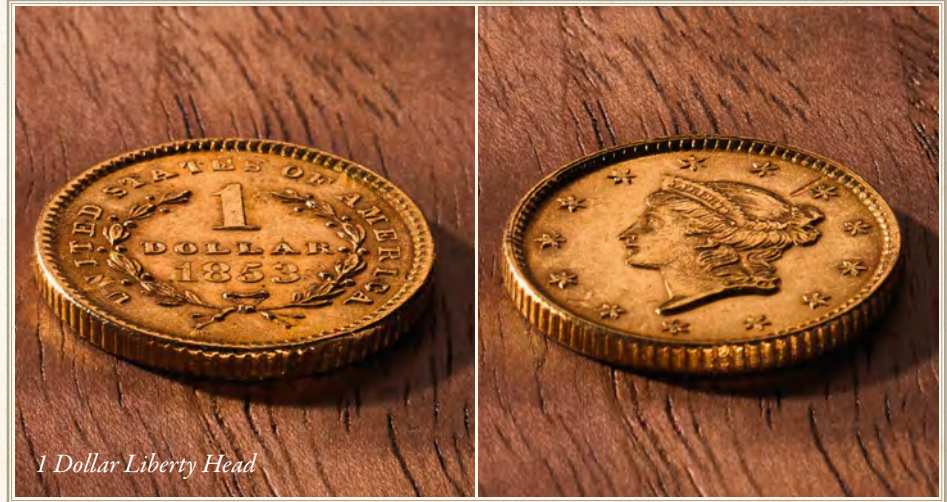
1 Dollar Liberty Head

Vanaf 1849 kwam er veel goud uit Californië op de Amerikaanse markt. De regering besloot om een grote hoeveelheid van dit edelmetaal om te zetten in munten. Philadelphia bleef de hoofdstad voor de Amerikaanse muntslag. Munten in Philadelphia geslagen, hebben geen muntteken. In de negentiende eeuw werd het aantal Munthuizen in de V.S. uitgebreid.