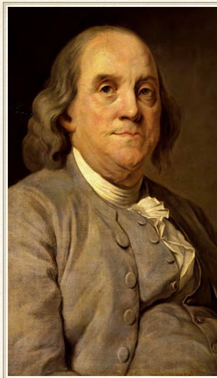
▲ Portret Benjamin Franklin

Er was dus veel te zeggen voor deze arend als het nationale symbool. Toch was er ook verzet tegen deze keuze. Benjamin Franklin, medestichter van de V.S., betreurde de keuze. Hij stelde dat de arend een opportunistisch dier was dat liever voedsel stal van andere