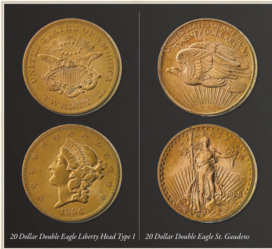
20 Dollar Double Eagle Liberty Head Type 1

Als gevolg van de ontdekking van goud in Californië in 1849, werden twee nieuwe denominaties aan de Amerikaanse munten toegevoegd, de gouden muntstukken van $1 en $20. Vooral het $20 stuk moest veel goud in munten omzetten. Hij woog tweemaal zoveel als een 'gewone' Eagle. De waarde was US $20. Hij heette dan ook een Dubbele Eagle. Tussen 1849 en 1933 (toen de Amerikaanse economie instortte en president Roosevelt het privébezit van goud verbood) gaf Amerika vele varianten uit van Dubbele Eagles ($20), Eagles ($10), Halve Eagles ($5) en Kwart Eagles ($2,5).