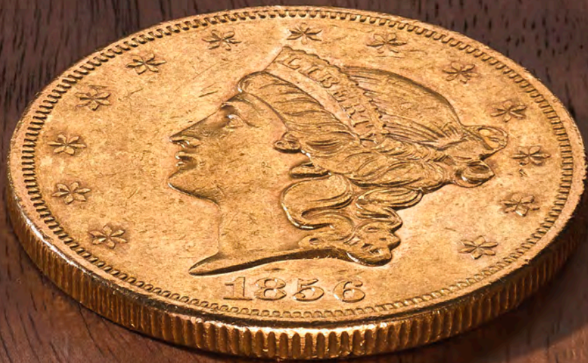
20 Dollar Double Eagle Liberty Head Type I