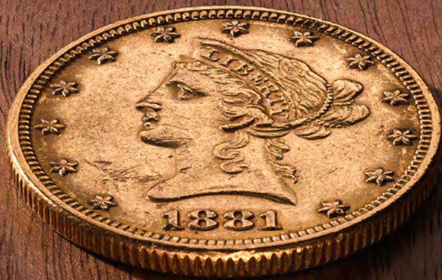
10 Dollar Liberty Head (met motto)