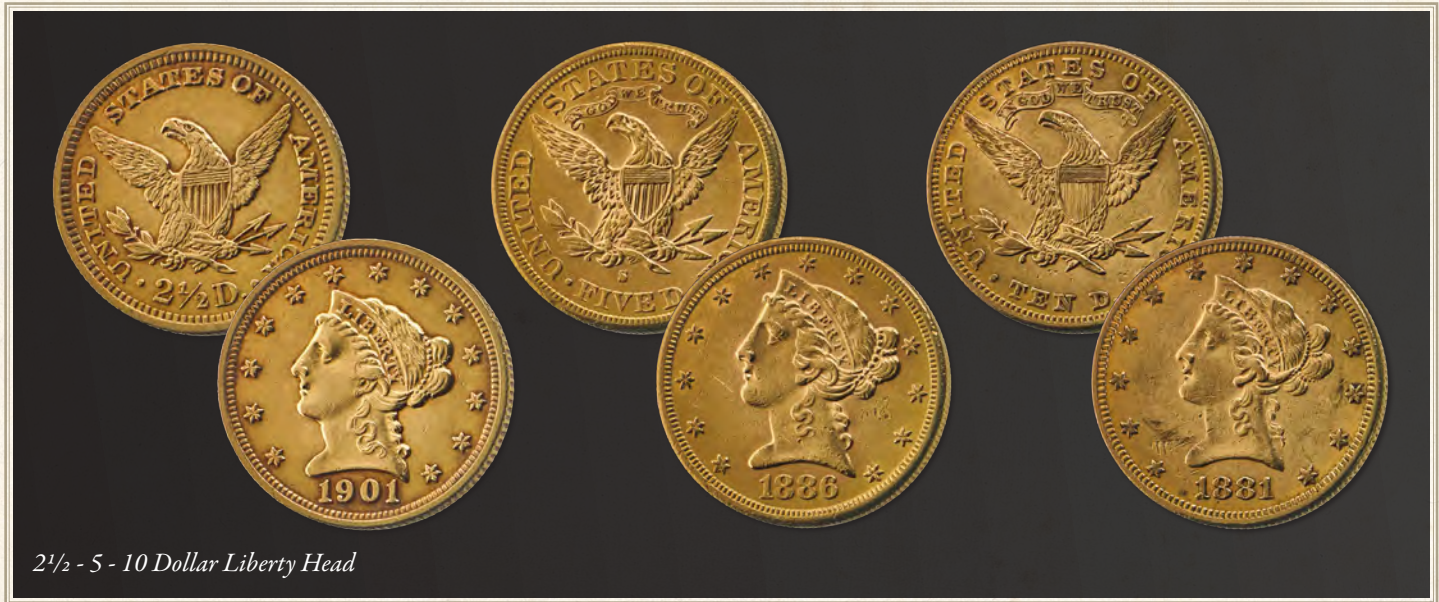
2 1/2 - 5 - 10 Dollar Liberty Head

de V.S. Rond 1795 sloeg de Munt van Philadelphia in kleine hoeveelheden alle muntsoorten die in de wet waren genoemd.