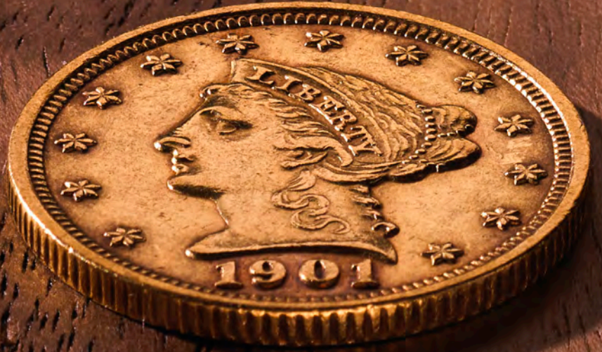
2 1/2 Dollar Liberty Head